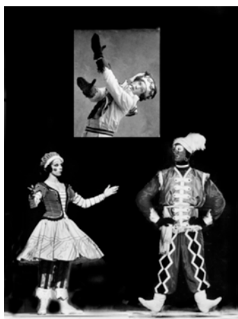
Nijinski / Wilfride et Jean dans « Pétrouchka »