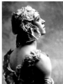
Nijinski